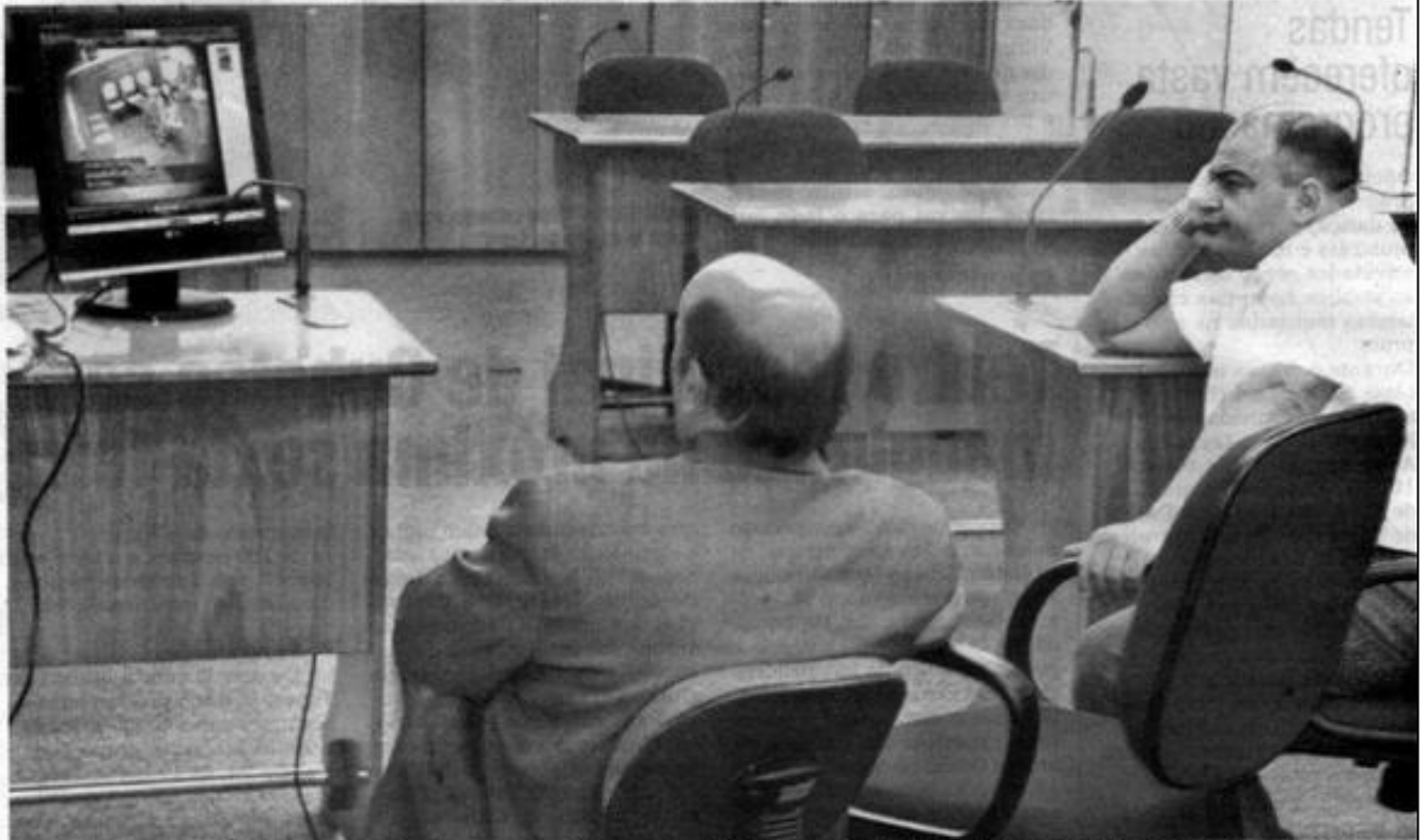
A Comissão Processante irá apurar os depoimentos e, depois, elaborará um relatório a ser encaminhado ao plenário que julgará os vereadores afastados