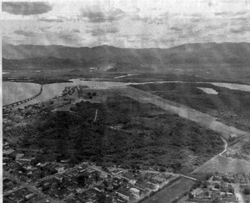
A Base Aérea deve receber a primeira equipe de técnicos na próxima semana, para iniciar o trabalho

"Essa decisão demonstra claramente a intenção da Aeronáutica porque ninguém autoriza alguém a entrar na sua casa, medir e furar o chão se não tiver intenção de que o casamento dê certo. Ainda não representa o casamento, mas é como se o pai da noiva tivesse deixado o noivo frequentar a casa com maior intimidade", explica o secretário municipal