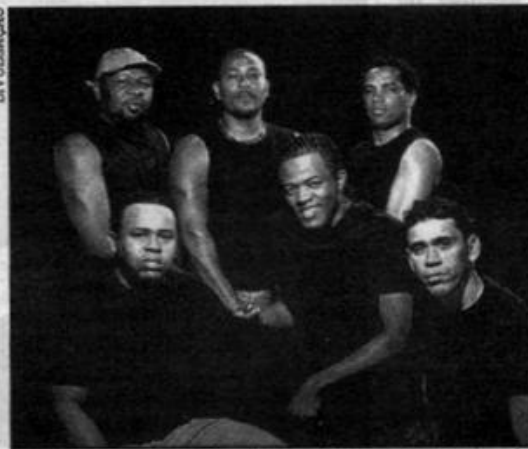
O grupo Revelação faz show na faixa em Praia Grande Colorido, segundo DVD

12º disco da banda. A noite traz ainda o som do T6 Legal, que abre a balada a partir das 19 horas.